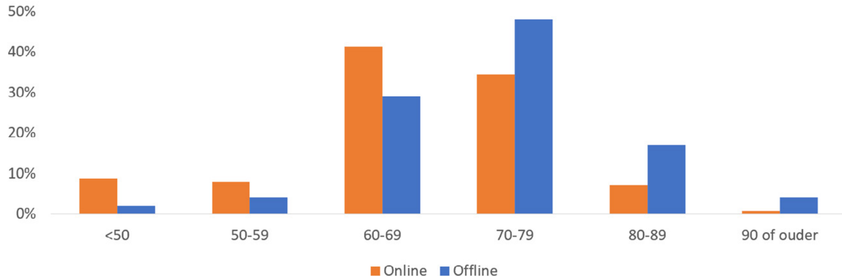
Leeftijd alle deelnemers

De Baanbrekers breken een lans om vrij te denken en zetten bakens uit. Hun ideeën en verwachtingen doen ons als Vlaamse Ouderenraad, professionals uit de sector en beleidsmakers stilstaan bij hoe het anders kan. En ze geven richting waar we naartoe moeten als we oplossingen willen bieden voor de steeds groter wordende groep ouderen in Vlaanderen.